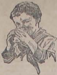
La leche Favorita de los niños

Una nota de palpitante realidad actual domina toda la narración, donde el pasado está en función del presente. Del experimento comunista de los primeros cristianos palestinos, al de la colonia libertaria de la Gorgona, desde la libertad de una familia de esclavos en las