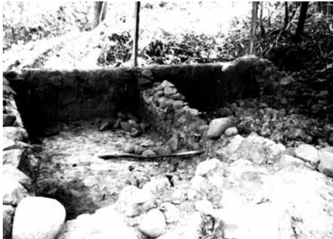
Obraje en el bosque de Cinquera

En la época postcolonial, fue una región dedicada a la explotación del añil, la abundante afluencia de agua en la zona y suelos con buen drenaje fueron factores para la extensión del jiquilite en la zona.