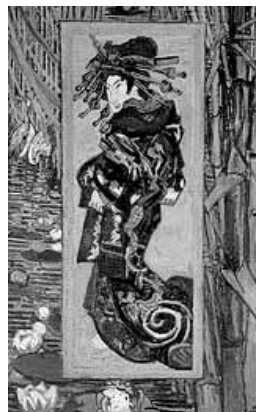
De courtisane (naar Eisen)

En los dos años en que permaneció en París, Van Gogh pintó nada menos que 27 autorretratos. Como no disponía de dinero para pagar a modelos, utilizaba su propio rostro para experimentar con el color y la técnica. Bajo la influencia del arte pictórico neoimpresionista, realizó en aquella época sus cuadros a base de pequeños puntos y rayas en colores claros y brillantes. Una importante fuente de inspiración fueron las estampas japonesas grabadas en madera, que el mismo artista coleccionaba. De hecho,