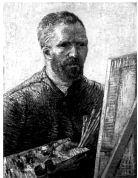
Vincent van Gogh (1853-1890)

pensó en dejar su trabajo y establecerse por su cuenta. Vincent temió un futuro incierto para todos y contó a Theo por carta que se sentía una carga para él y su familia.