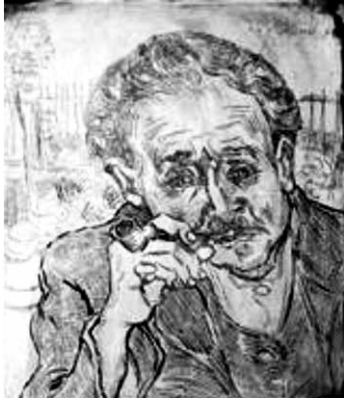
Portret van dr. Gachet

mitía, podía incluso trabajar fuera de la residencia. Allí surgieron paisajes con cipreses y olivos en vivas pinceladas que sugieren movimiento. La composición de color es en general más suave y menos intensa que en sus pinturas de Arlés.