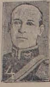
Genl. Marinaduke Grove

SANTIAGO DE CHILE, Via Madrid, 14. — Radio. — Carlos Dávila ha dimitido la presidencia de la República en la Junta de Gobierno.