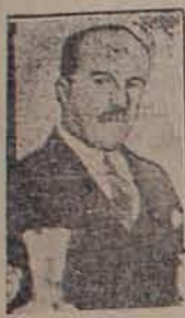
Doctor Carlos Dávila