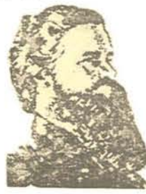
SAMUEL FIELDEN (Prisión perpetua)