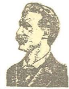
AUGUSTO SPIES (Ahorcado)