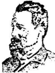
OSCAR W. NEEBE (Condenado a 15 años)

Los comunistas y sus cómplices de la siniestra recalcitrante, le han dicho al mundo con fanática e hipócrita reiteración, que el día 1 de mayo, de 1886, hubo una huelga en Chicago que, aunque fracasada y de resultados trágicos, tiene gran significado para la clase laborante o trabajadora, por cuanto, afirman cínicamente, esa fecha marca un jalón en los anales de la historia de la lucha reivindicativa de los trabajadores de todo el mundo.