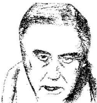
F R A N K L I N DEL ANO Roosevelt, p a r a l í t i c o - político pseudo - norteamericano, que por la hipócrita vía democrática —con la estafa del voto libre, secreto e igualitario — se

falso Carlos Enrique Marx era además de cleptomano, drogadicto; aunque casado y padre de unas mujeres licenciosas, se rumoraba que era homosexual ya que gustaba de rodearse de muchachos a los que pervertía no sólo con sus tenebrosas doctrinas, sino con sus muchos vicios. Las ideas siniestras que propagó, no eran suyas, las robó a otros autores, tan locos como él.