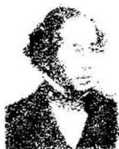
BENJAMIN DISRAELI , judío-inglés; llegó, mediante intrigas a convertirse en Primer Ministro en la pérñda Alblón; Disraeli, conociendo como conocía el