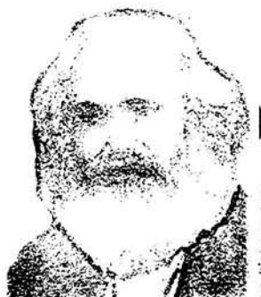
KISSEL M O R DEKAI , judío - alemán fue el más desvergonzado plagiarador literario que jamás haya registrado la historia del mundo; el

insurgencia política, social y económica, a pesar de haber sido uno de los usureros más inmorales y cínicos de entonces. En sus factorías pagaba a sus empleados y trabajadores sueldos miserables y los trataba como esclavos. Redactó juntamente con el judío - alemán Kissel Mordekai (alias Karl E. Marx) el mamotreto "EL CAPITAL" y "el manifiesto comunista".