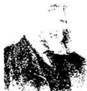
FEDERICO ENGELS judío - alemán de la peor laya, y uno de los capitalistas más ricos de su época asociado con otros financieros de su "raza" apoyó la

insurgencia política, social y económica, a pesar de haber sido uno de los usureros más inmorales y cínicos de entonces. En sus factorías pagaba a sus empleados y trabajadores sueldos miserables y los trataba como esclavos. Redactó juntamente con el judío - alemán Kissel Mordekai (alias Karl E. Marx) el mamotreto "EL CAPITAL" y "el manifiesto comunista".