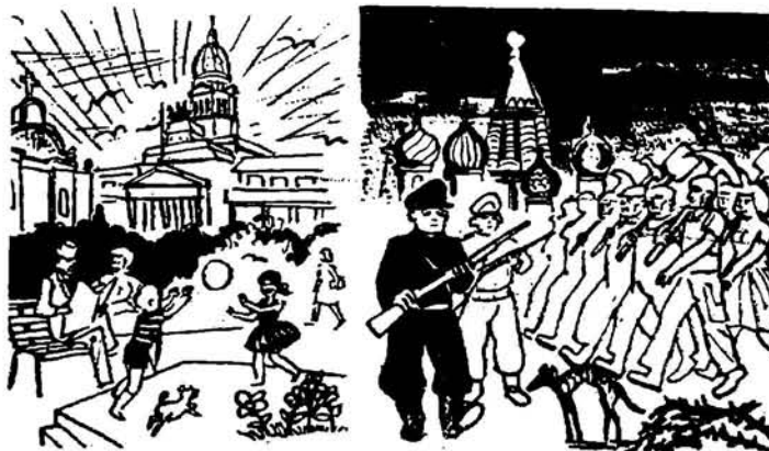
dos formas liberantes de vida.