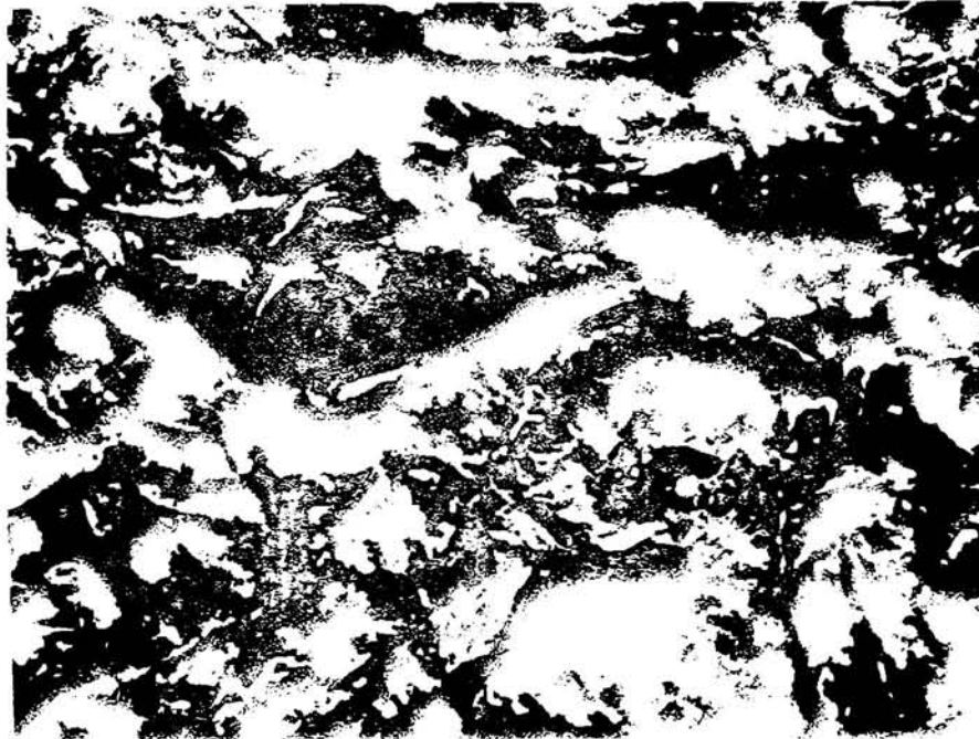
ADEMAS DE ASESINAR A 15 MIL MILITARES POLACOS QUE ERAN SUS PRISIONEROS DE GUERRA, LOS RUSOS MATARON 15 MIL MILITARES ALEMANOS EN EL MISMO SITIO.

ENTRE LOS MESES DE ABRIL Y MAYO DE 1942, LOS RUSOS ASESINARON A 15.000 OFICIALES DEL EJERCITO POLACO ENTERRANDOLOS EN FOSAS COMUNES EN LOS BOSQUES DE KATYN.