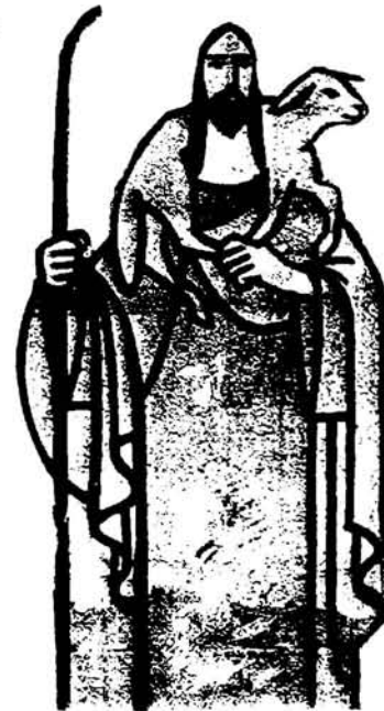
ASI HARLARA JESUCRISTO

¿Cuál es la forma más efectiva de los conspiradores de ablandar a los cristianos? Mediante la infiltración de los seminarios teológicos, de las universidades y de la jerarquía eclesiástica, tal cual lo han venido haciendo. El lavado cerebral ya ha progresado hasta un punto en que alto porcentaje de sedicentes "cristianos", pastores y sacerdotes, ya no creen en la divinidad de Jesucristo.