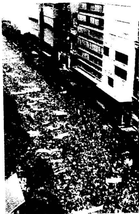
El pueblo brasileño ha demostrado siempre su repudio a la dictadura comunista. Prueba de ello fue la gigantesca manifestación efectuada el 2 de abril de 1964 en Río de Janeiro, según lo muestra la foto.

— Todo lo que sirva para preservar a América, bastión de cristiandad, contra la hidra roja que socava las conciencias e intoxica a los hombres hasta en la infancia, como en el caso de las drogas, las modas y la literatura pornográfica.