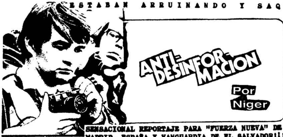
SENSACIONAL REPORTAJE PARA "FUERZA NUEVA" DE MADRID, ESPAÑA Y VANGUARDIA DE EL SALVADOR!!!