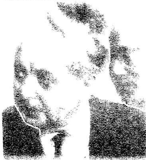
Wilson se ve desbordado por los comunistas. Es una historia muy vieja, mil veces repetida.

internacional, sea por su propio peso. Los «diversos grupos de activistas teóricos» a los que alude «The Economist», han pasado a la acción cuando la coexistencia, propugnada por Moscú —aceptada por el mundo occidental, les ha asegurado la impunidad y hasta la benevolencia.