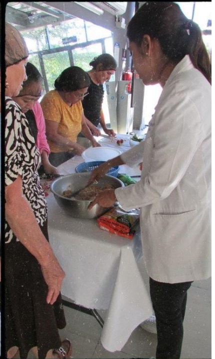
400TM 49 400TM