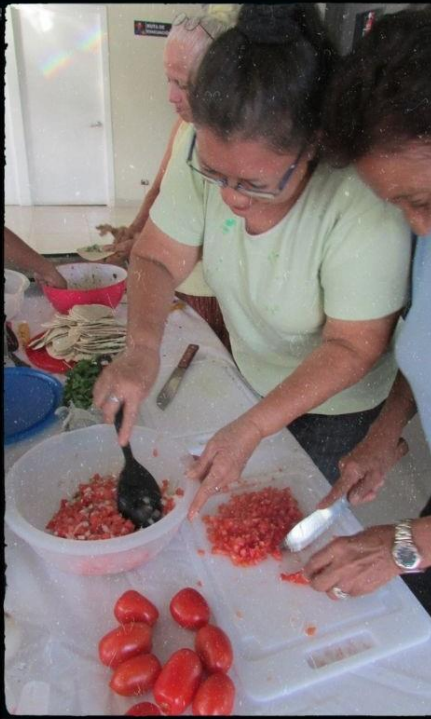
47 400TM 48