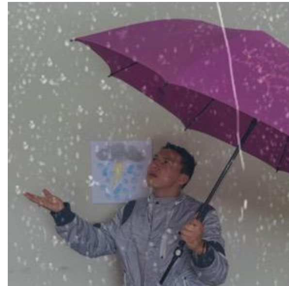
Lenin Sorto(2021) "Los 4 impactos". Foto Ensayo. Serie Fragmento de 4 imágenes que cuentan el impacto del cambio climático en los últimos tiempos. Olas de calor, nevadas destructoras, potentes tornados y Tormentas arrasadoras.