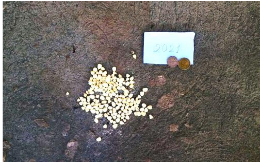
Josué Guillermo Pereira (2021) “Lo que el tiempo nos enseña” . Foto Ensayo compuesto por una Secuencia de seis fotografías.