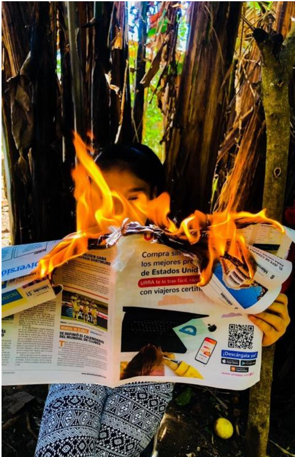
Belén Gómez (2021). "Alto a los incendios". Autorretrato. Fotografía independiente. Fotografía Digital a Color.