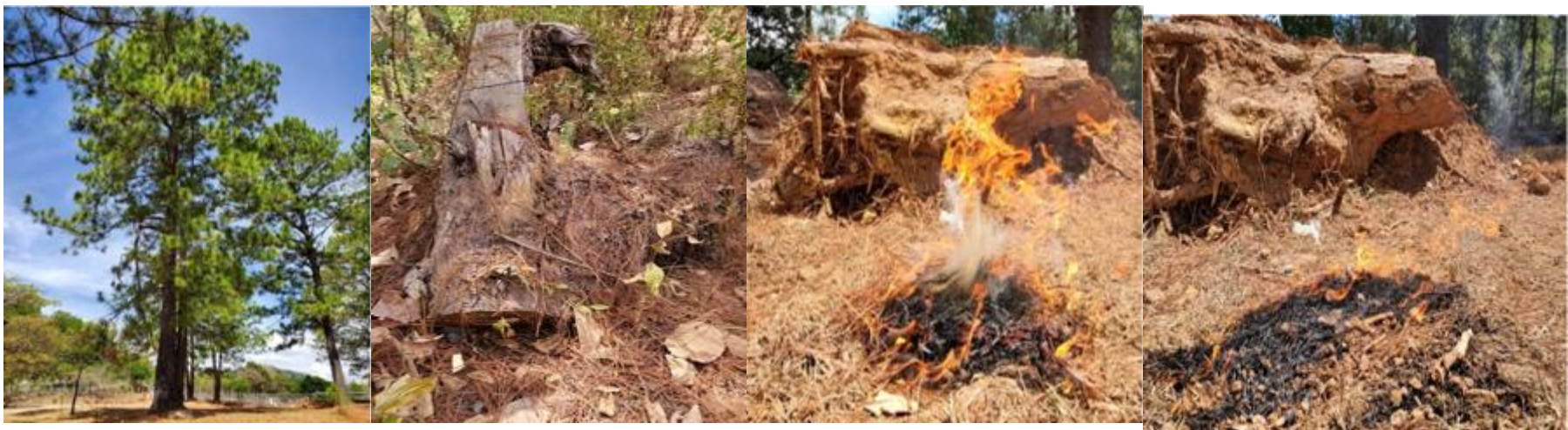
Angie Mariflor Argueta (2021) “Etapas de destrucción, consecuencias de la tala de arboles” Foto Ensayo compuesto por una serie de cuatro fotos.