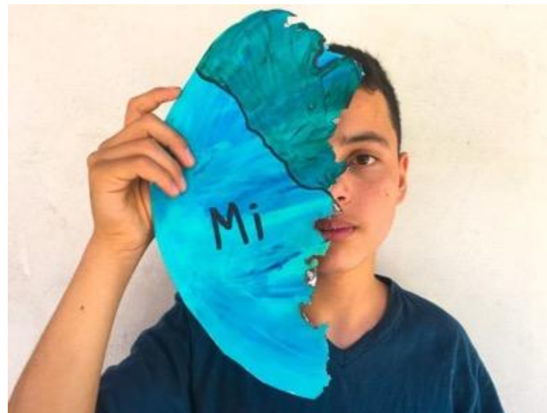
Melkin Espinoza (2021). “La destrucción de mi Hogar” . Foto Ensayo compuesto por una Secuencia de 5 fotos.