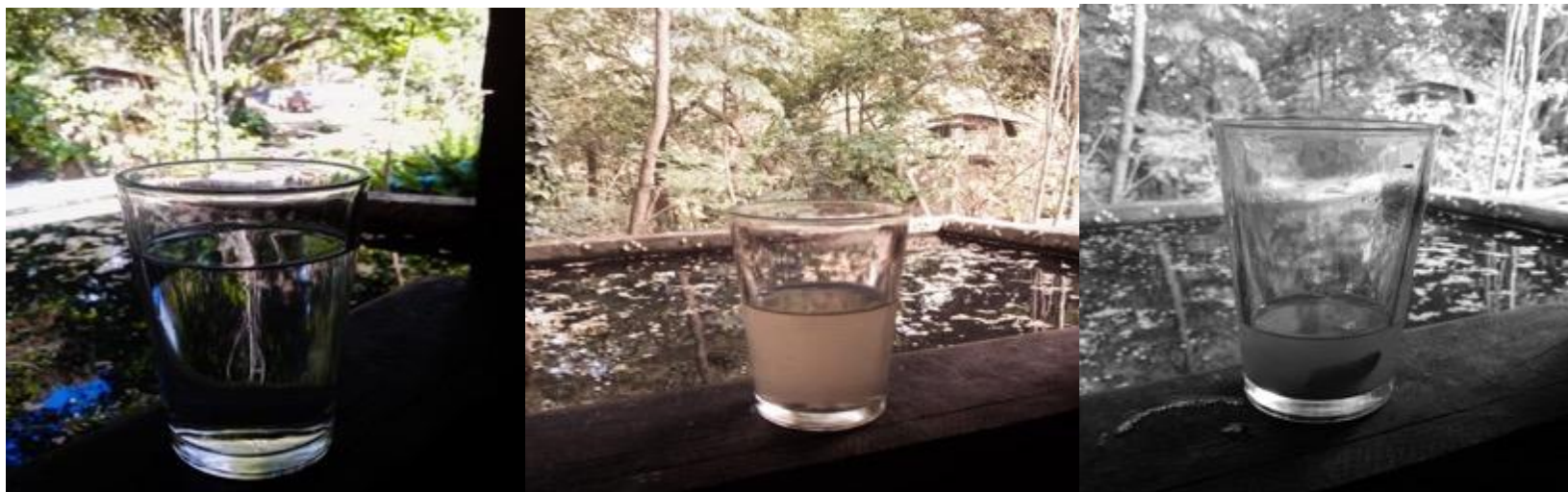
Fátima Rodríguez (2021). “El agua contaminada” . FotoEnsayo , formado por una serie de tres fotografías