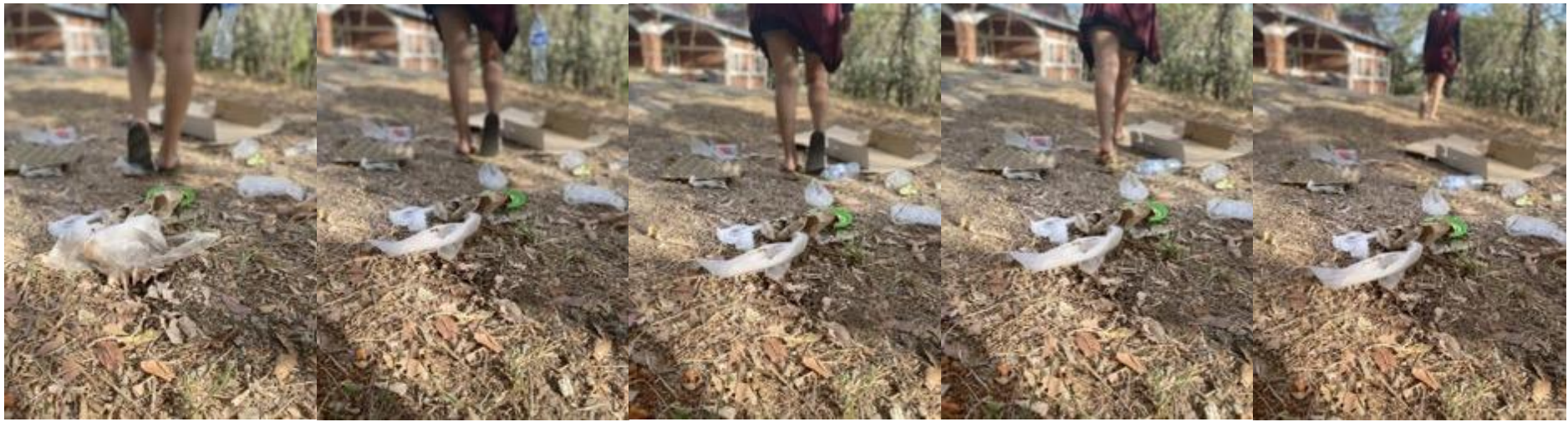
Verenice Elena Díaz (2021) “INDIFERENCIA”. Foto Ensayo compuesto por una secuencia de cinco fotos.