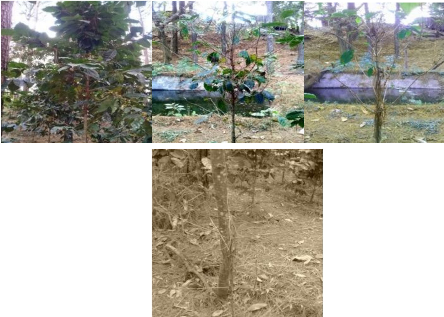
Sandra Rodríguez (2021). “La falta de agua” . Foto Ensayo compuesto por una serie de cuatro fotografías.