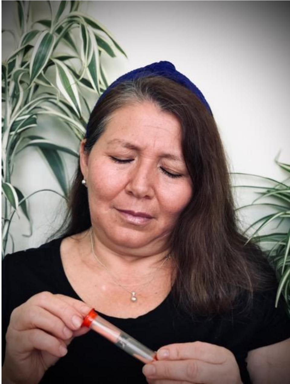
Lenin Sorto (2021). “ Un segundo menos ”. Retrato, fotografía digital a color.

Este retrato, expresa tristeza y dolor, a causa de lo que el mundo está sufriendo por nuestras acciones. El retrato contiene muchos elementos, como lo son: las plantas, éstas representan la naturaleza, un fondo gris que refleja tristeza. La actriz emana angustia y sufrimiento, que nos da a entender que el mundo está sufriendo y clamando por ayuda. Uno de los elementos más importantes, es el reloj, este demuestra que cada cosa que hagamos en contra de la naturaleza, es un segundo menos para ella, y para nosotros.