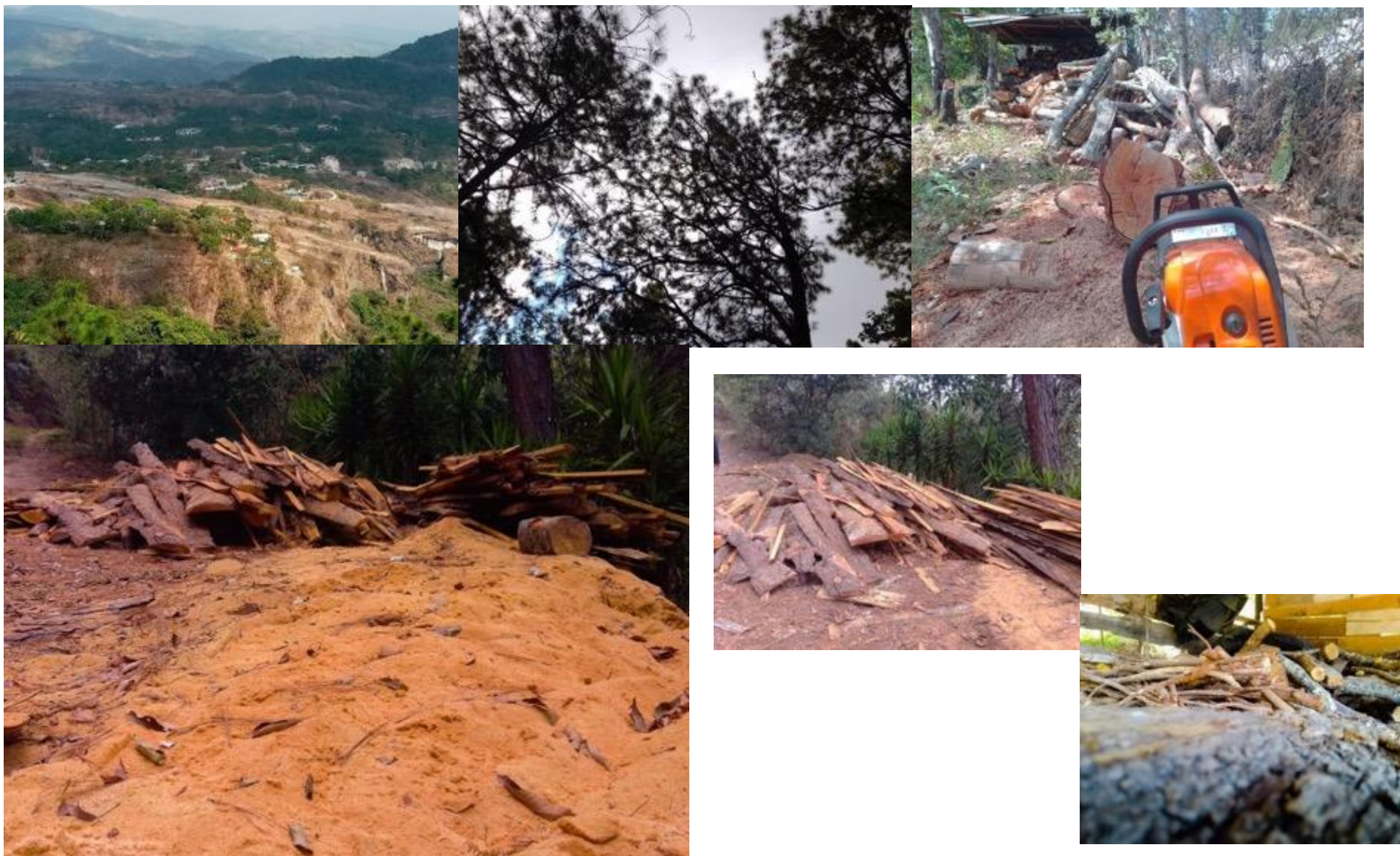
Melkin Espinoza (2021). “La plaga humano descortezador” . Foto Ensayo compuesto por una serie Fragmento de 6 fotos.